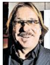
Schauspieler Götz George geht mit 73 Jahren keine Kompromisse mehr ein.

„Ich merke jetzt im Alter, dass einem die Zeit wegläuft. Ich mache nur noch das, was mir gefällt.“